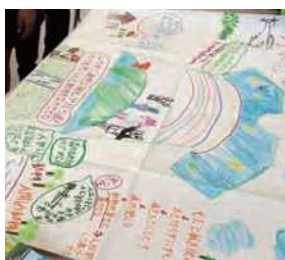
クリエイティブな自分を発見！