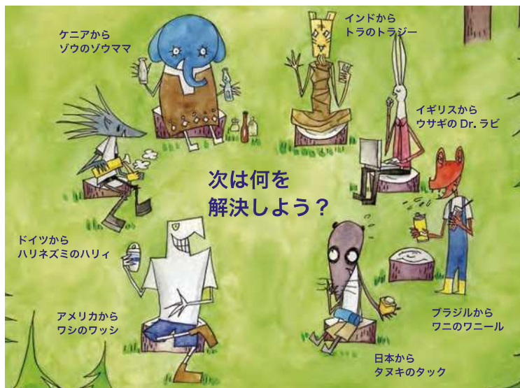
人間から動物へ → 動物かんきょう会議 → 動物から人間会議へ