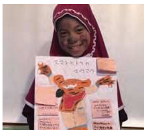
世界の子どもたちと創発！